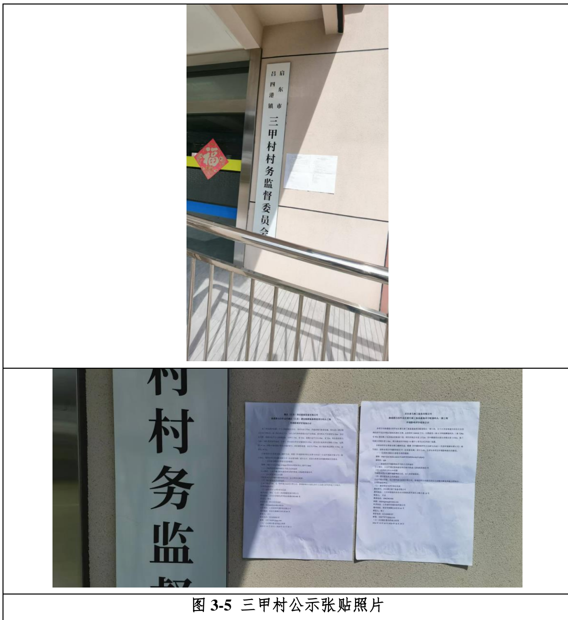
图 3-5 三甲村公示张贴照片