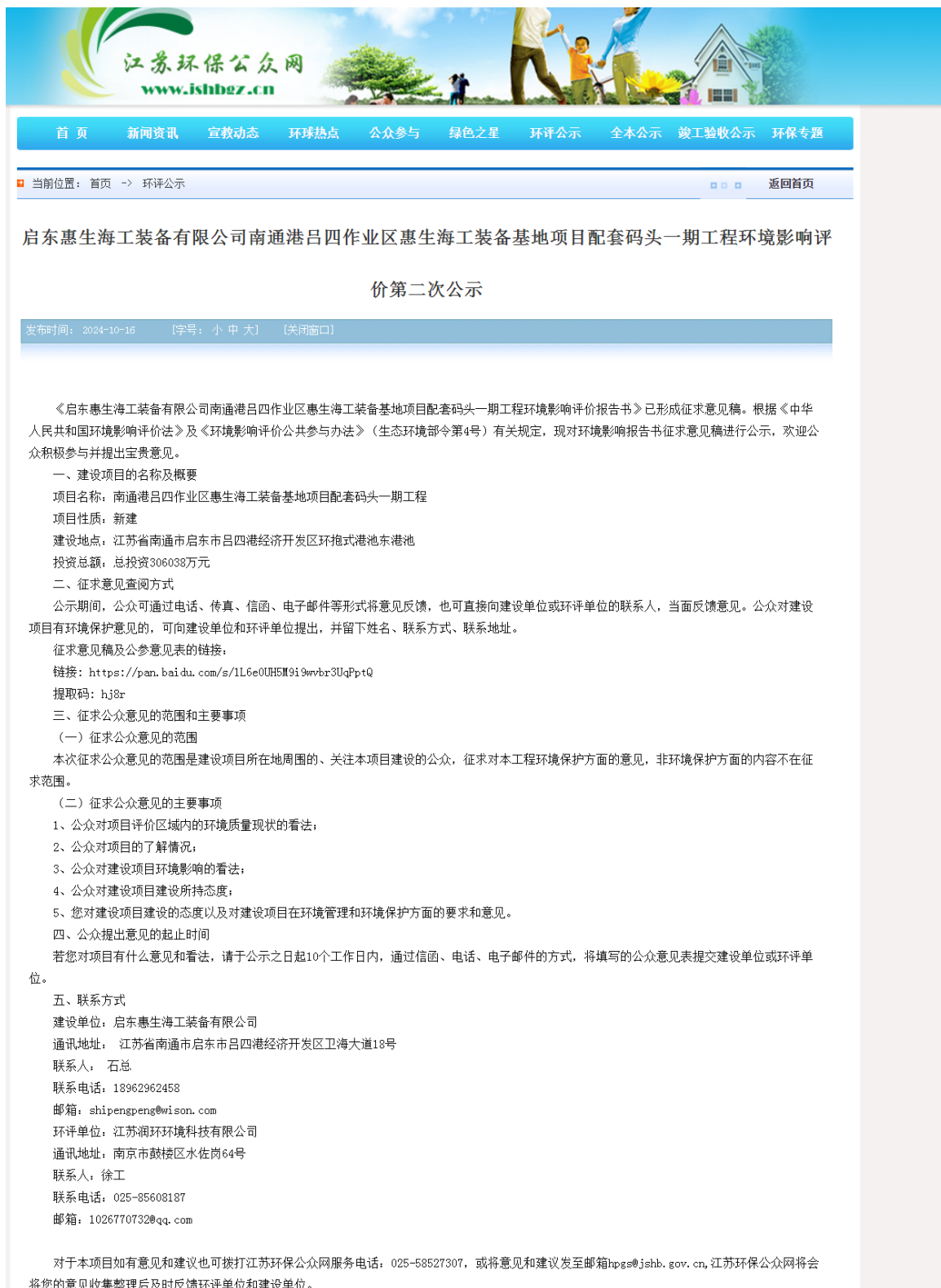
图 3-1 征求意见稿公示截图