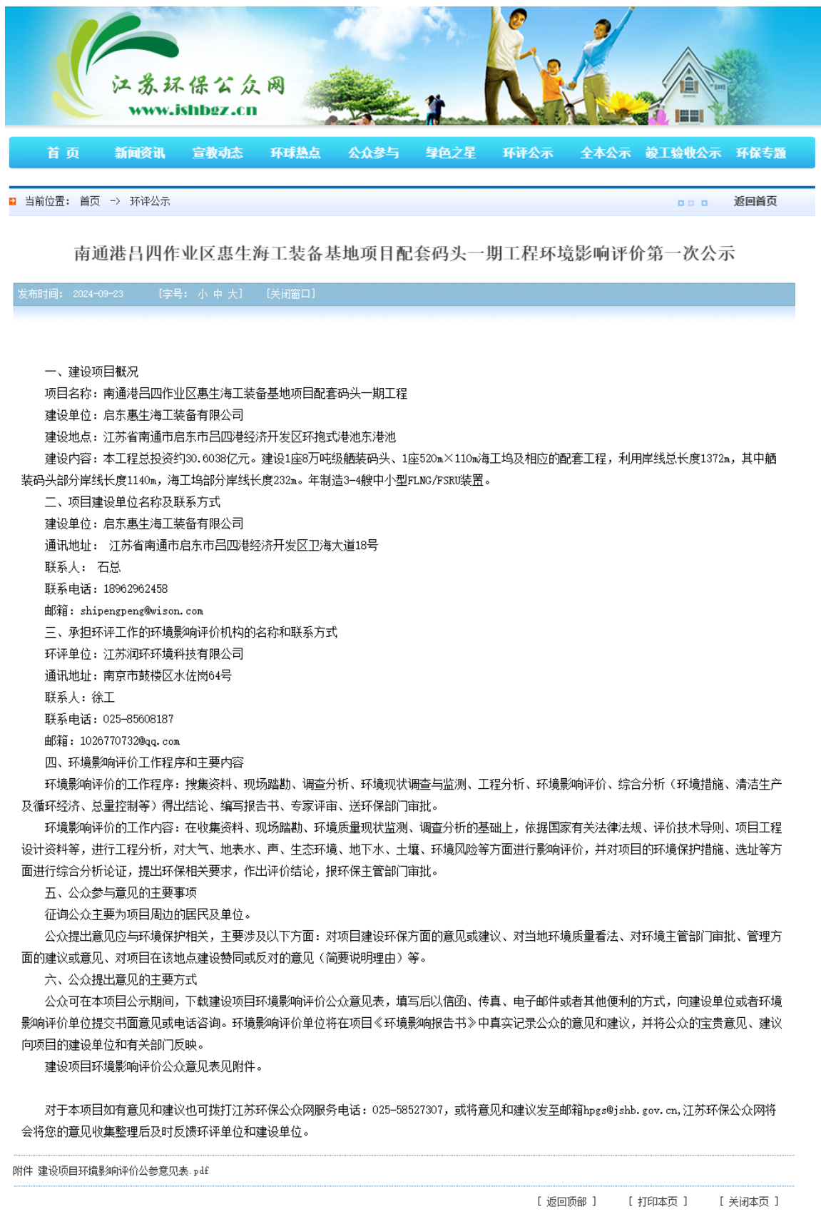
图 2-1 首次环境影响评价信息网络公示截图