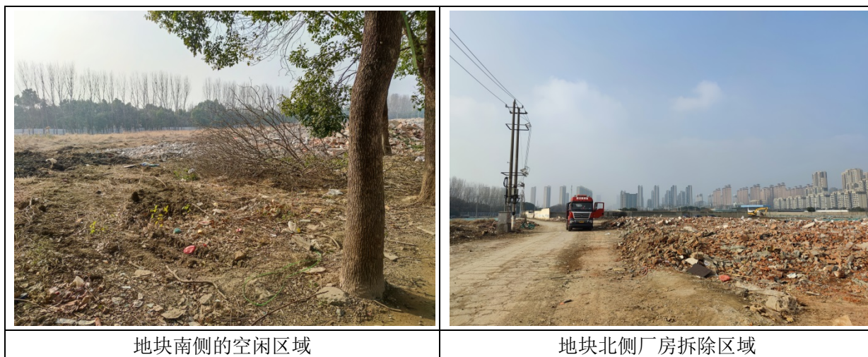
图 2 地块现状图

地块土地利用历史情况： 地块内 2005 年 2009 年，主要分为企业和居民区，居民区主要分布在地块西南侧，企业主要分布在地块北侧和东侧；2009 至 2012 年，地块主要分为企业和居民区两个部分，两部分位置未发生变化，但相较于上一时间段，居民住宅数量略有减少，东北侧区域增加了厂房，在 2011 年时地块内西北侧的无锡市惠鸿氟材料装备有限公司进行了搬迁，厂房未进行拆除，后期厂房主要进行租赁，进行机械加工等作业生产活动；2012 至 2014 年，地块内西南侧原居民住宅大部分都已完成了搬迁拆除，仅在地块中部留有一两栋居民住宅，北侧的无锡市沃尔得精密工业有限公司也进行了搬迁拆除，其余区域未发生明显变化；2014 年 2021 年，地块内分为企业、住宅区和空闲地三部分，地块南侧的空闲地后期作为无锡市园林绿化树枝指定堆放点进行使用，原无锡市沃尔得精密工业有限公司区域作为空闲地；2021 年至今，地块内企业厂房和住宅开始逐渐搬迁拆除，现场留有原厂房和住宅拆除后的建筑垃圾。地块内现状为空闲地。